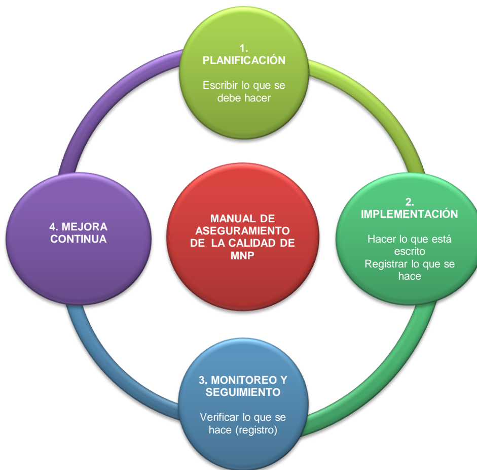
Figura 2. Manual de Aseguramiento de Calidad de MNP

El aseguramiento de calidad de los MNP comprende las fases siguientes: