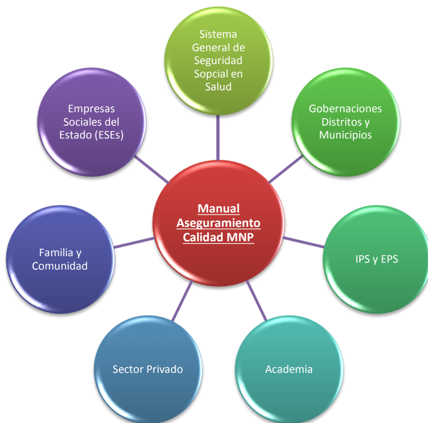
Figura 1. Destinatarios Manual Aseguramiento Calidad MNP.

La siguiente figura recoge los diferentes destinatarios del manual.