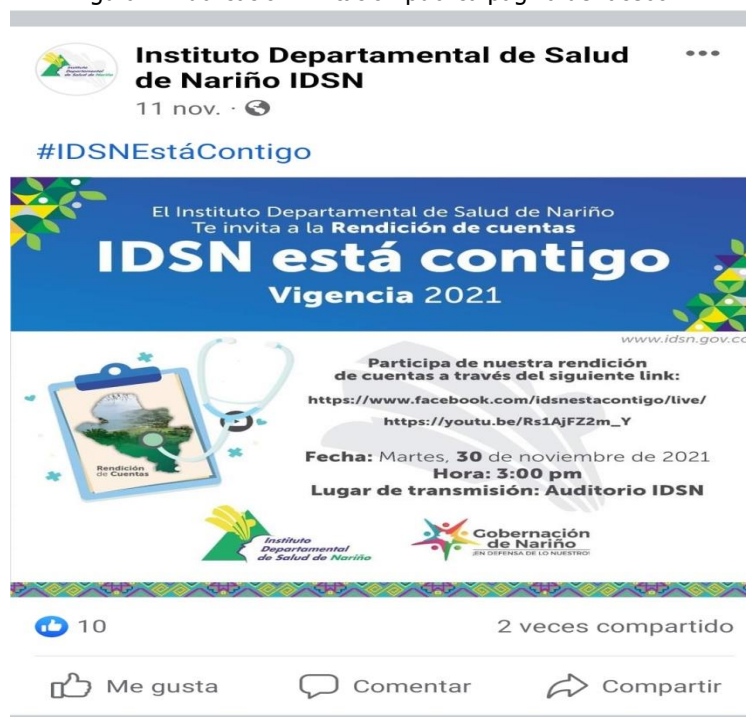
Figura 2. Publicación invitación publica pagina de facebook

De igual manera en la misma fecha se publico la invitacion en pagina del IDSN de facebook https://m.facebook.com/story.php?story_fbid=5157049104324444&id=1356913741004685