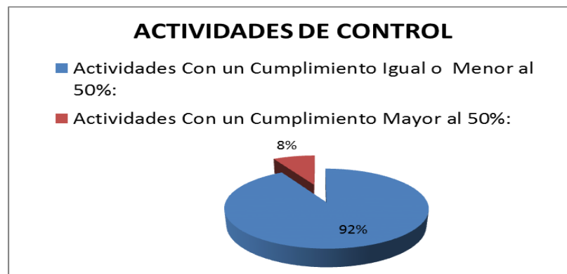
GRAFICA No. 02 PORCENTAJE DE CUMPLIMIENTO DE ACTIVIDADES DE CONTROL

Total Actividades de Control: 134 Actividades Actividades Con un Cumplimiento Igual o Menor al 50%: 123 Actividades Con un Cumplimiento Mayor al 50%: 11